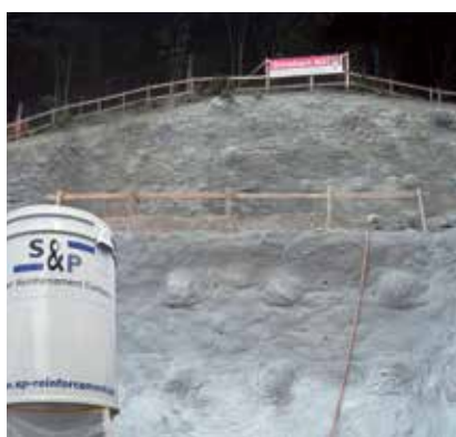
5 Obras geotécnicas (Excavación, muros de soporte)