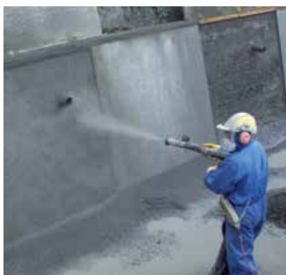
2 Canales de agua