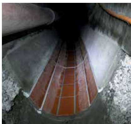
1 Reparación de canalones y canaletas