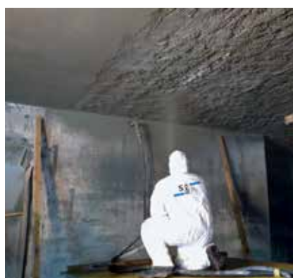
4 Refuerzo en construcciones (Aumento de la seguridad)

Software y Manuales de dimensionamiento / Referencias / Datos técnicos / Especificaciones / Ensayos / Publicaciones