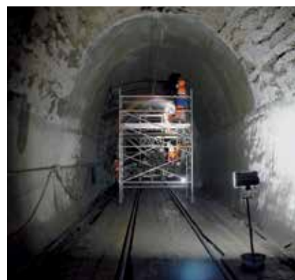
3 Túneles y pasos hidráulicos